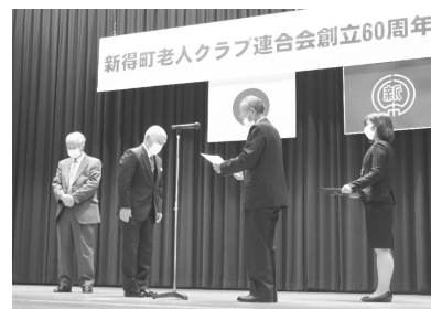
創立60周年記念表彰